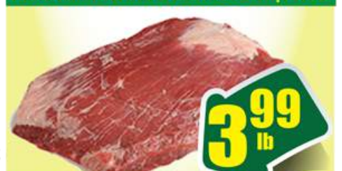
Pork Ham Roast Boneless - Thịt Heo