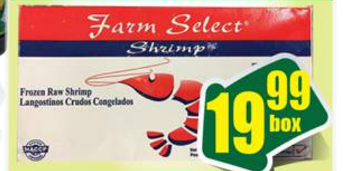
Fresh Water 2-4 H/O - Tôm Càng 2 lbs