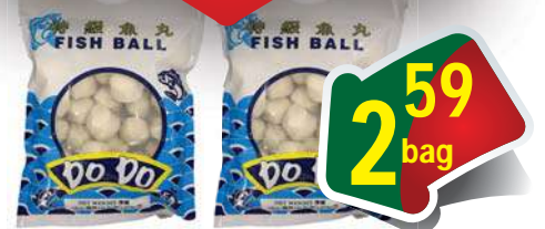
Do Do Fish Ball - Cá Viên - 16 oz