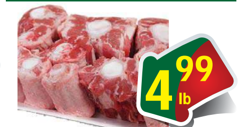
Beef Oxtail - Đuôi Bò