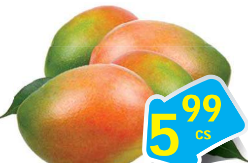
Kent Mango - Xoài Kent