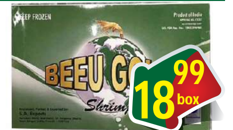
Black Tiger Shrimp 31-40 - 4 lbs