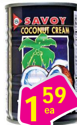
Savoy Coconut Cream Savoy - Nước Cốt Dừa 14 Fl oz