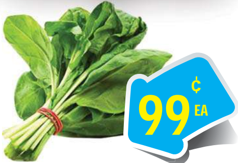
Spinach - Rau Dền