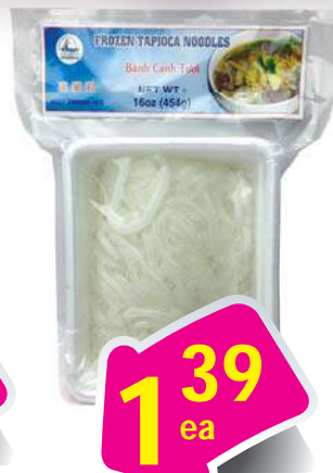
VN Lady Fz Tapioca Noodle - Bánh Canh 16 oz