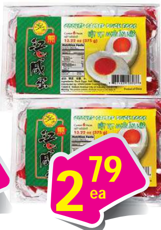
Asuka Cooked Salted Duck Egg - Hột Vịt Muối 6 pcs