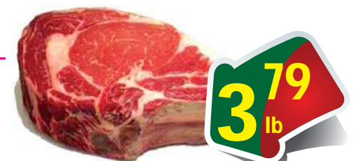
Beef Ribeye Steak - Sườn Bò Mềm