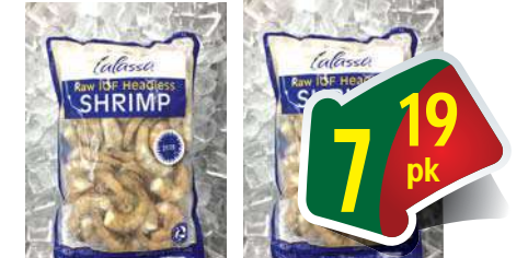
White Shrimp 31-35 - 24 oz - Tôm Trắng