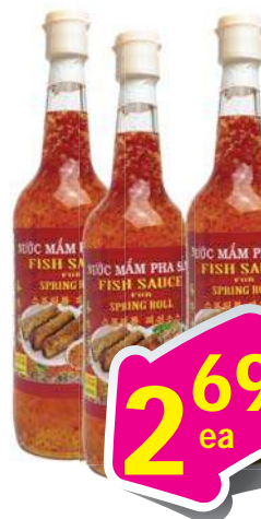
VN Lady Fish Sauce Nước Mắm Pha Sẵn 22 Fl oz