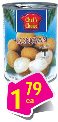
Chef's Choice Longan In Syrup - Nhân Hộp 20 oz