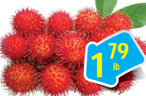
Fresh Rambutan - Chôm Chôm