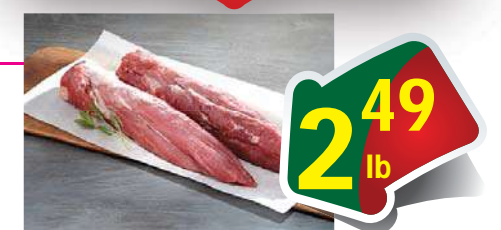
Pork Tenderloin - Thịt Heo Thăn Lưng