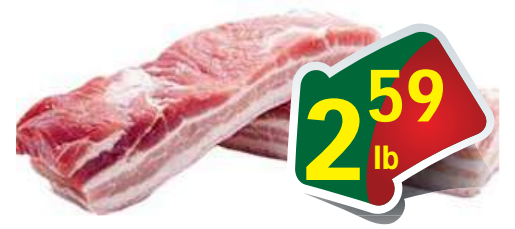
Pork Belly Regular - Ba Rọi Heo