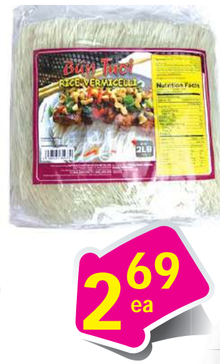
Duy Anh Rice Vermicelli Bún Tươi Duy Anh 2 lbs