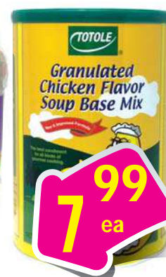
Totole Chicken Powder Bột Nêm Gà 2.2 lbs