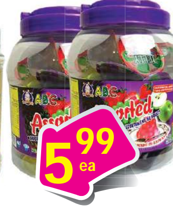
ABC Assorted Fruit Bites - Rau Cầu 19.40 oz