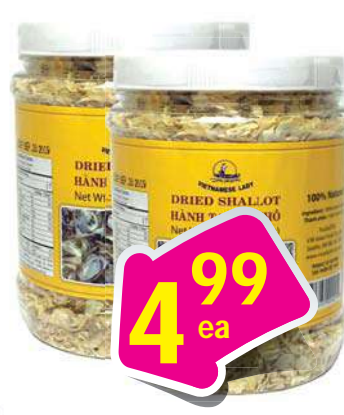
VN Lady Dried Shallot Hành Phi 14 oz