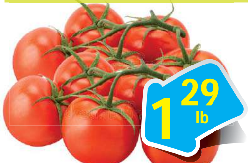
Tomatoes in Vine - Cà Chua