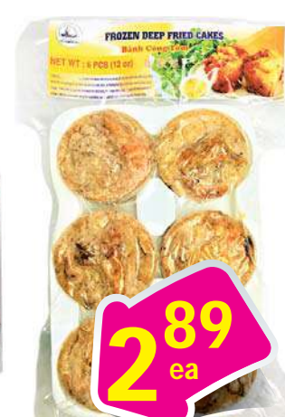
VN lady Fz Dêp Fried Cake - Bánh Cóng 12 oz