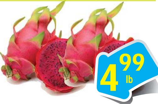
Red Dragon Fruit - Thanh Long Đỏ