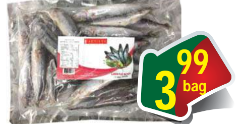
Scad Size 8-12 - 2 lbs - Cá Nục Chuối