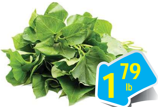
Yam Leaves - Rau Lang