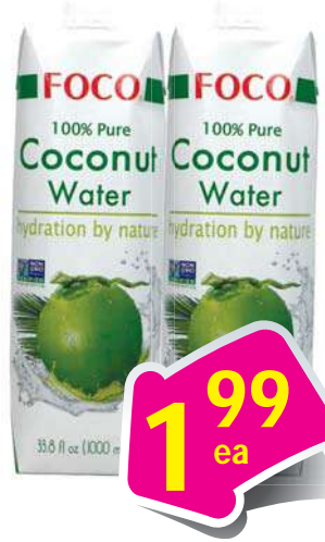
Foco Coconut Water Nước Dừa 33.8 Fl oz