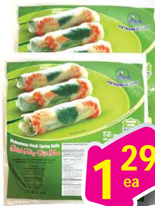
VN Lady Rice Warpper Bánh Tráng Dẻo 12 oz