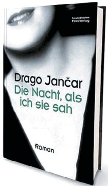
Prvi na avstrijski decembrski lestvici je slovenski roman.

Jančar je za roman lani prejel tudi nagrado Prix du Meilleur livre étranger, nagrado za najboljšo tujo knjigo, ki jo podeljuje združenje francoskih