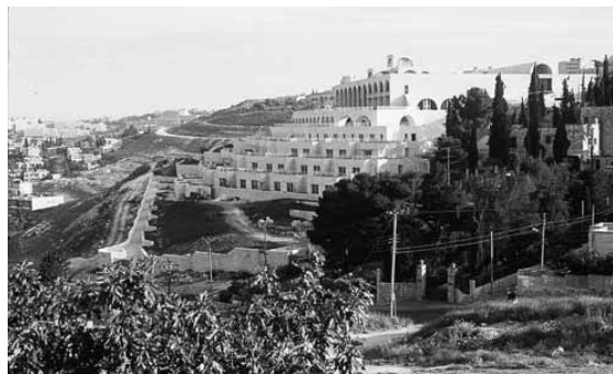
BYU Jerusalem Center