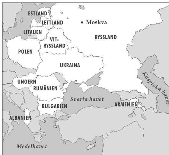
Under president Bensons ämbets tid invigde kyrkans ledare ett flertal länder för evangeliets predikande.

8. Den 24 juni 1991, vid en bankett efter en konsert med tabernakelkören i Moskva, tillkännagav vicepresidenten för den ryska sovjetrepubliken att kyrkan var officiellt erkänd i hans land. Detta gjorde det möjligt för kyrkan att upprätta församlingar överallt i denna stora republik. Under 1990-talet blev ett antal tidigare sovjetrepubliker och länder i mellan- och östeuropa invigda för evangeliets predikande, bland annat Albanien, Armenien, Vitryssland, Bulgarien, Estland, Ungern, Lettland, Litauen, Rumänien, Ryssland och Ukraina. Lokaler för kyrkan hyrs och byggs i vart och ett av dessa länder, och många människor får ett vittnesbörd om evangeliets sanningar. Vid invigningen av det första möteshuset för sista dagars heliga i Polen sedan före andra världskriget, bad äldste Russell M Nelson i de tolv kvorum om att möteshuset skulle fungera som 'en tillflyktsort för bekymrade själar och en hoppets fristad för dem som hungrar och törstar efter rättfärdighet' [ Church News , 29 jun 1991, s 12]. Denna välsignelse uppfylls i många länder i de heligas liv som har funnit evangeliets frid och glädje.