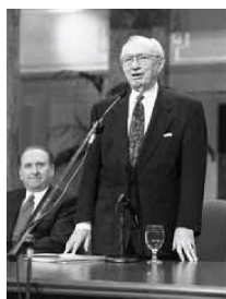
Gordon B Hinckley", Nordstjärnan , jun 1995, s 22].

4. President Hinckley sade om detta ögonblick: 'Jag begrundade hans svar, och nästa morgon läste vi vid våra skriftstudier detta uttalande av Herren: "Ty den som vill rädda sitt liv skall mista det, men den som mister sitt liv för min och för evangeliets skull, han skall rädda det" (Mark 8:35). Det vidrörde mig. Detta uttalande, detta löfte, i samband med min fars brev, fick mig att gå upp till andra våningen ... knäfalla och ingå ett förbund med Herren att jag skulle försöka glömma mig själv och börja arbeta. Jag betraktar den dagen som den dag då jag fattade mitt livs beslut. Jag kan se att allt gott som hänt mig sedan dess hänger samman med det beslut jag fattade den gången' [Gordon B Hinckley: Man of Integrity, 15th President of the Church , video (1994)].