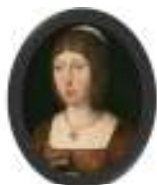
קתרינה הגדולה 1796 - 1762