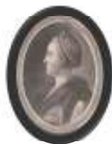
אליזבת I 1603 - 1558