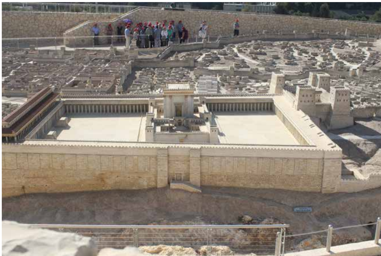
Modellby av Jerusalem slik den var på Jesu tid. Vi ser templet i forgrunnen.

Helge: Ja, det er akkurat det. Og med hensyn til dette med æonen, så er kirkefedrene helt ubevisst på det som følger med. De må bearbeide traumet og lager en teologi, ja, de skaper en teologi som hjelper dem i den prosessen.