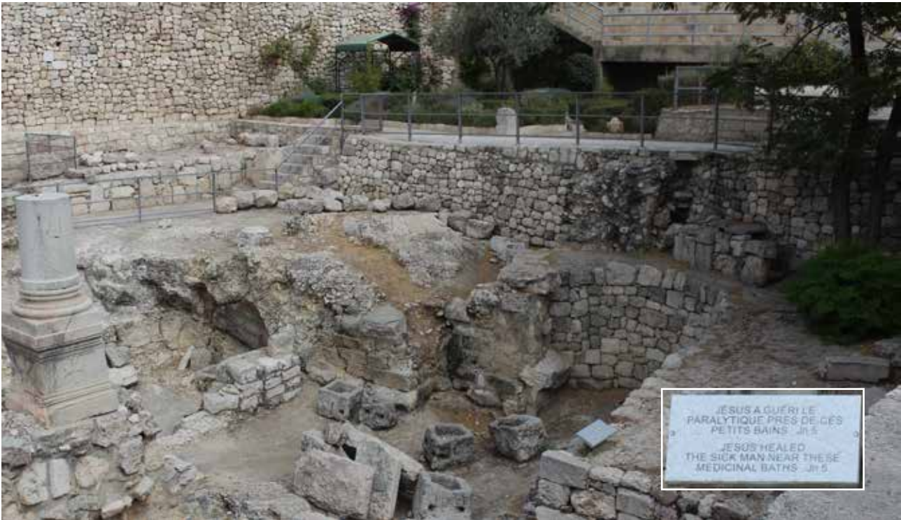
Ved Betesda-dammen, slik den her fremtrer i dag, steg til visse tider en engel ned og berørte vannet. Under en sabbat helbredet Jesus en person som var lam på dette stedet. Inskripsjonen (se detalj) på plaketten refererer til Joh. kap 5.