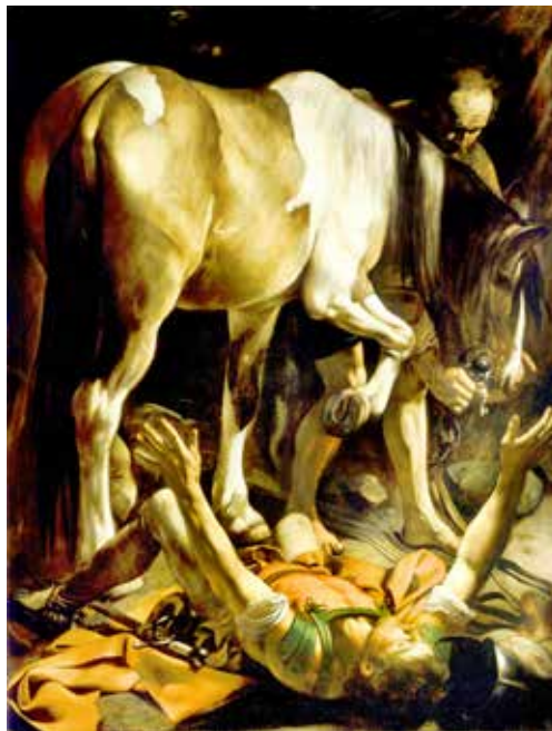
Pauli omvendelse av Caravaggio, malt ca. år 1600