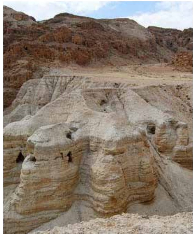
Det klosterlignende anlegget i Quram hadde rituelle bad. I bakgrunnen ses Dødehavet. Fjellhulene der de første Dødehavsrullene ble funnet, ligger bare noen hundre meter unna klosteret.