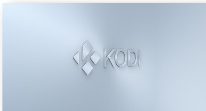
Tela inicial de Kodi

Ao abrir o Kodi Custom na primeira vez, é possível uma tela popup seja exibida, pedindo permissão para que o Kodi seja incluído nas exceções do Firewall do Windows, na qual deve-se clicar em Permitir e o Kodi será aberto, exibindo essa tela inicial. Você está no Kodi Custom.