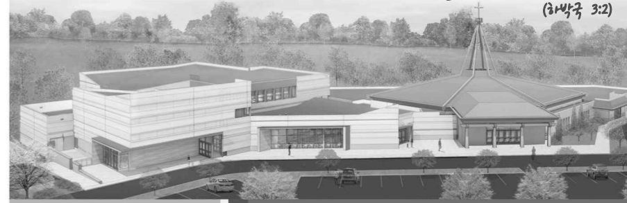
Revive Your work in our days (Habakkuk 3:2)