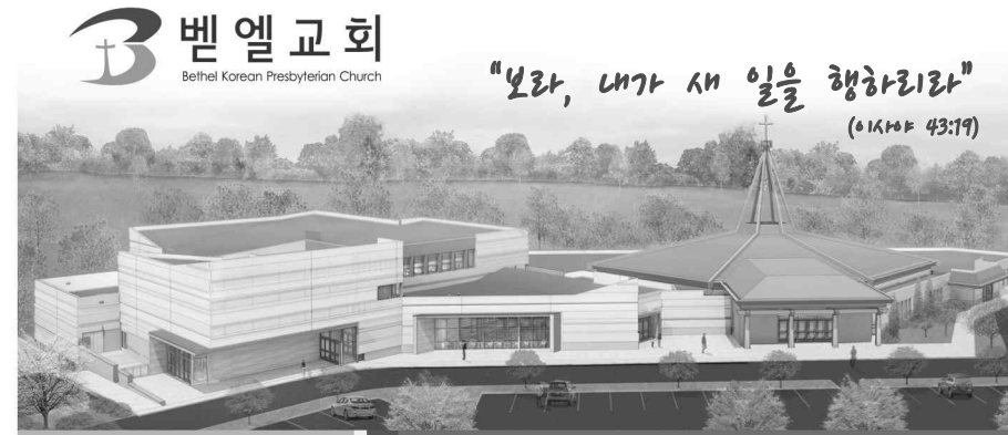
Behold, I will do a new thing! (Isaiah 43:19)