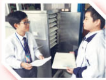
「中一中二留校午膳計劃」