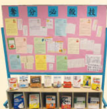
「奪分必殺技」專題展覽

圖書館於10月7日至31日舉行名為「奪分必殺技」的專題書展，展出多本有關學習法、筆記術的書籍，並設展板張貼相關圖書的內容簡介及精選輯錄，希望同學能從書中學到更多學習技巧，應用於日常學習，獲取更佳成績。