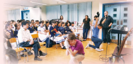
多元學習課—宗教活動

本學年共安排中一及中二在多元學習課中參與信仰活動，以強化全校的宗教氣氛，增加學生在宗教及德育方面的培育；而十月終為萬聖節，故本組希望在此作適當的教導，特於十月初的多元學習課加插「認識萬聖節」的講座，且安排外隊訪校，整體的氣氛良好，學生亦投入活動。