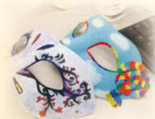
放下歧視，認識愛滋病 及愛滋病感染者所面對 的困難吧！

愛滋寧養服務協會於2011年首度舉辦面具設計比賽，以面具作為愛滋病感染者懼怕公開病情及自我保護的象徵，邀請學生及公眾人士透過創作面具，認識愛滋病及愛滋病感染者所面對的困難，從而消除歧視。本年度的主題為「向歧視說不 繪出平等社會」，同學以繽紛的色彩設計面具，希望為感染者送上祝福，並引起公眾人士關注。