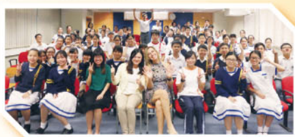
Our English Prefects