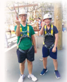
「Team Building Camp」 「新任領袖生訓練營」