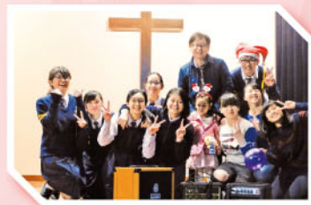
音藝比賽及聖誕聯歡活動情況

本年度音藝比賽及聖誕聯歡活動已於2016年12月23日舉行，當天賽事順利完成，各參賽學生運用多種類的樂器以粵語、英語及國語歌曲參賽，數百學生到場打氣，學生會同學帶領抽獎及表演環節，氣氛良好，並能依時完成。