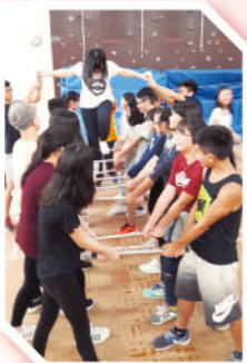
「過天梯」個人挑戰競技活動。

2014年11月5日至6日，課外活動組舉辦「飛躍領域1617」領袖訓練計劃，參加者主要來自學生會正、副會長、六社正、副社長及學會的主要幹事共27人。於上水展能運動村舉行領袖訓練營，目的是透過不同難度的分組競技比賽，提升幹事們群體合作的團隊精神，並培訓幹事們的解難能力，從而培養其領袖特質及才能。