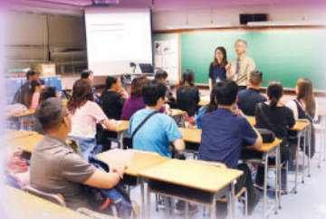
中一班主任與家長暢談中一同學校園生活概況