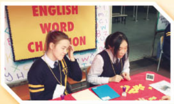
TTC Info Day

12. The English Department was involved in the establishment of a station in TTC Information Day 2016. A game stall was set up and videos were shown to introduce the English teaching and learning at the school.