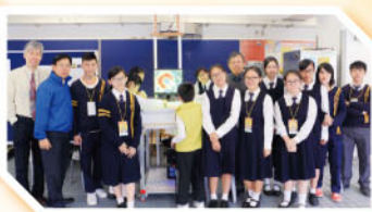
崇真資訊日—電子沙箱