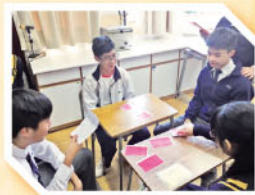
The Spellink League