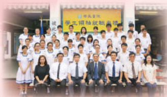
新任學生領袖與正、副校長、助理校長及學生培育主任合照