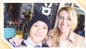
Speech Festival — One of Our Winners