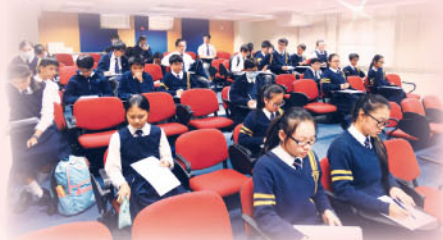
學生議會第一次大會情況

本年度學生議會第一次大會已於2016年12月20日舉行，議員對教與學及教學支援方面作出提問及建議，當中主要以增加選修科的數目、部分多元學習堂轉為自修堂、容許學生選擇性訂購報紙、豐富周會主題及內容、增加電子課本及教學資源、午膳時間開放教學資源中心、容許初中學生攜帶平板電腦等作出討論，校方已回應各提問。會後各班議員將於班上報告各校方回應。