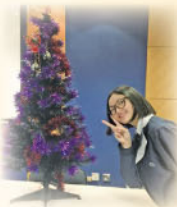
English Club - Christmas Celebration