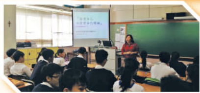
「關愛自己・由清楚自己開始」工作坊

4. 為推廣積極及健康的生活模式，本科安排中四及中五修讀健康管理與社會關懷科的學生，參加香港營養學會「Wellness4U」中學免費營養教育計劃，由註冊營養師入班教授與「專業人士對話：營養師之路」及「健康體重管理及「增肌」必勝法」兩個課題。