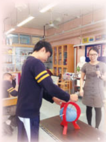
嘩！小心呀！ 壓力太大會爆煲！

本組邀請了新生精神復康協會職員蒞臨本校舉辦【消除壓力】講座，讓中三級同學認識心理希望防範於未然，以更正確的方法去處理壓力，活出健康人生。