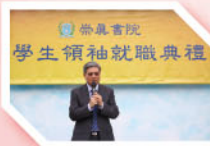
黎校長對新任學生領袖勉勵

本年度領袖生、朋輩輔導員、健康家族、學生會幹事、學會幹事及六社幹事的就職典禮在10月5日的早會舉行。新任學生領袖透過宣誓儀式，承諾肩負領導及服務全校同學的重任。