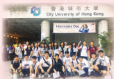
中五同學於香港城市大學合照

活動於2016年10月15日舉行，安排全體中五同學於參觀香港城市大學及香港浸會大學開放日，使同學對大學各學系的課程及入學條件，有更清晰的瞭解，並能預早籌備升學計劃。