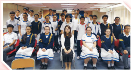
全體學生議員與負責老師合照