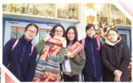
出發前來一張合照！