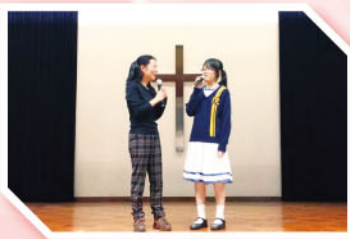
「網絡欺凌，健康行動」

秉承以往方向，訓導組繼續著意建立正向教導的組織文化，以教導學生為依歸，讓學生最終能明辨是非、確立正確人生目標。在過去的半年裡，我們一直與班主任、輔導組、教育心理學家及社工共同處理了多個學生個案，並與警方保持緊密聯繫，共建校內的安全傘。同時亦不斷支援有需要的課堂，發揮共同合作的最大效益。同時，我們在這期間舉辦了多個講座，教導同學如何正面發展、健康成長，例如在多元學習課舉辦「網絡欺凌，健康行動」及「性騷擾講座：拆解謎思」；於周會舉辦「約會紅綠燈」及「網絡罪行」講座。此外，訓導組亦鼓勵同學以功抵過，繼續推行「自省更新」及「守時銷過」的計劃，協同學糾正錯誤行為，培養正向品格。