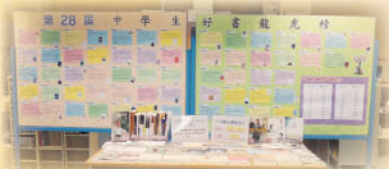
第28屆中學生好書龍虎榜展覽

為鼓勵同學閱讀好書，圖書館與中文科協作，參與「第28屆中學生好書龍虎榜」活動。圖書館於活動期間展出60本候選書籍，供同學借閱，而中文科則安排學生參加「第28屆中學生好書龍虎榜」讀後感寫作比賽。