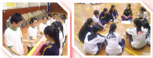
朋輩輔導員積極參與活動

10月28日，本組邀請「學友社潛能發展中心」到校舉辦「歷奇活動」，內容豐富，上午活動只有朋輩輔導員參加，目的是提高朋輩輔導員的自信心及團隊精神。下午活動則是朋輩輔導員及中一同學一同參與，目的是建立彼此互相合作精神。