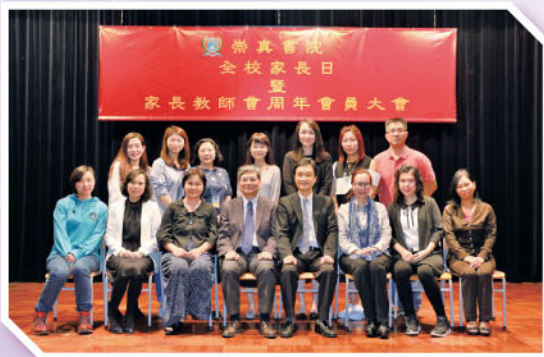
新任家長教師會（第十九屆）常務委員會全體委員與黎校長合照