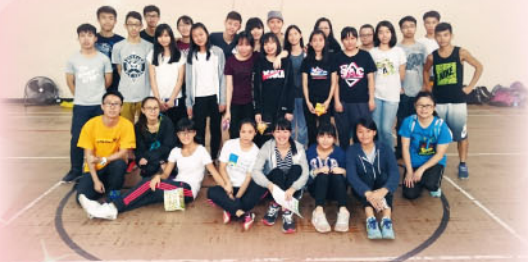
領袖訓練全體大合照。