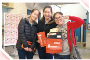
為善事出力，笑容更甜美呢。

上學期共舉辦了兩次賣旗活動，分別為9月17日【影音使團】及12月17日【睦福團契】，兩次賣旗活動共有116名中四學生及基督精兵參與，他們感覺興奮，亦認為活動饒有意義，能以一己之綿力，幫助有需要人士。