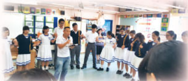
學生領袖培訓—基督精兵

本學年我們招募 20 位基督徒學生領袖，輔以聖經知識的培訓與實踐，讓他們在校內及校外服事，見證基督福音的真實與美善。在上學期，我們進行了三次聖經課程培訓；而基督精兵須在早會及周會領禱、分享見證，並參與初中團契，協助導師領組。