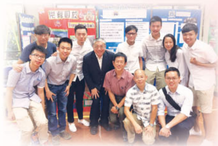
本校校友會成員及深水埗崇真舊校友合照

深水埗崇真小學暨幼稚園慶活動啟動儀式已於2016年10月8日舉行，當天本校校友會幹事出席以表支持，並以橫額及學校簡報，介紹本校近況。