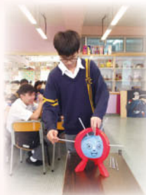
同學最感興奮的， 就是遊戲環節吧！