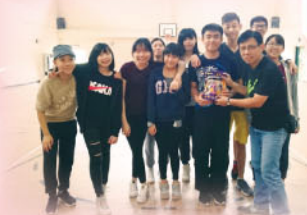
最佳合作小組接受頒獎。