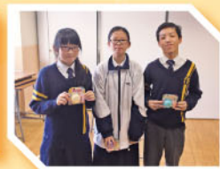
The Spellink League - Winners