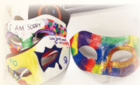
用色彩打破隔膜，支持 【愛滋寧養服務協會】 面具設計比賽。