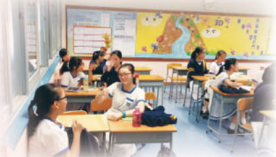
學習手語一點都不簡單

為鼓勵同學參與義工服務，關心社群，本組積極計劃多元化的義工活動，讓有興趣的同學獲得豐富的服務經驗。同時，上學期共有20位義工同學參與手語班，學習基礎手語，並與聾啞導師以手語溝通，希望好好裝備，日後有更多服務機會。