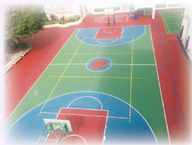
球場工程接近完成

有關工程於2017年1月24日完成。在此，感謝師生們的忍耐及包容，並多謝教育局及工程公司的協助，讓學校環境更安全、更美觀！