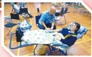
捐得是福、自得其樂