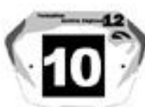
Junior Fet G en 20'' et Cruiser