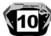
Elite1 Fet G en 20'' et Cruiser