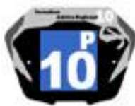
Filles / Femmes