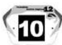
Junior Fet G / Elite2 en 20'' et Cruiser