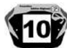
Elite1 Fet G en 20'' et Cruiser