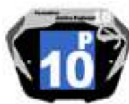
Filles / Femmes