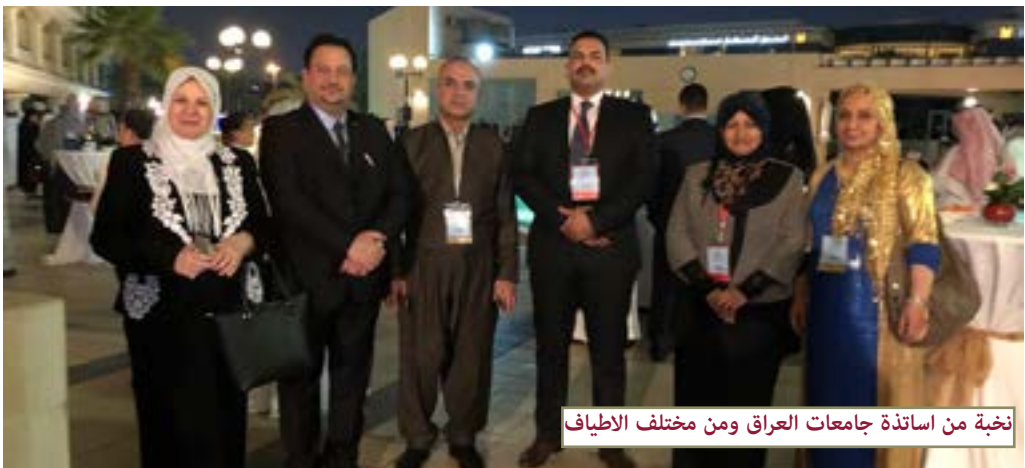
نخبة من اساتذة جامعات العراق ومن مختلف الاطراف

شارك في المؤتمر العديد من المنظمات العربية والدولية اضافة الى الاتحادات والهيئات العربية فعلى سبيل المثال لا الحصر شارك ممثلون عن اتحاد الجامعات العربية , اليونسكو, اتحاد المحامين العرب, اتحاد المصارف العربية, وممثلين عن مجامع اللغة العربية من العراق و الوطن العربي.