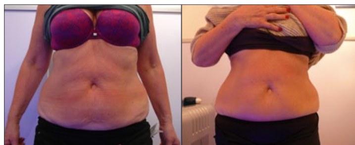
2. GABINET COSMETDERM (WROCŁAW, UL. OJCA BEYZYMA 1B, WWW.COSMETDERM.PL )

MĘŻCZYZNA, 30 LAT, PROBLEM: BRAK TALII, BOCZKI, LICZBA ZABIEGÓW: 6 (REDUKCJA OBWODU O OKOŁO 4,5 CM, MIERZONE W TALII I BOCZKACH)