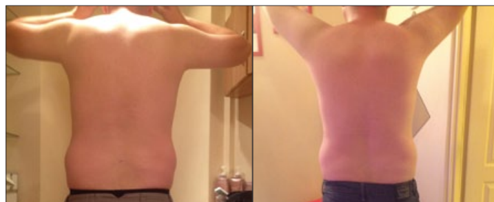
1. GABINET LOOK&BEAUTY (WARSZAWA, AL. KEN 88, WWW.LOOKANDBEAUTY.PL )

MĘŻCZYZNA, 30 LAT, PROBLEM: BRAK TALII, BOCZKI, LICZBA ZABIEGÓW: 6 (REDUKCJA OBWODU O OKOŁO 4,5 CM, MIERZONE W TALII I BOCZKACH)