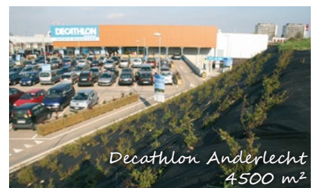
Decathlon Anderlecht 4500 m 2