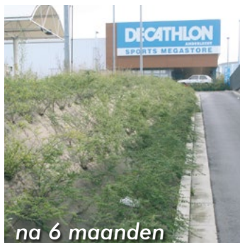
na 6 maanden

insulco bvba • I.Z. Zuid (1) • Rue Buisson aux Loups, 1a • 1400 Nijvel Tel : 067/41 16 10 • Fax : 067/41 16 16 • insulco@insulco.be Website : www.matgeco.be