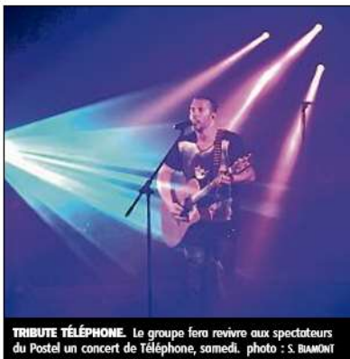
TRIBUTE TÉLÉPHONE. Le groupe fera revivre aux spectateurs du Postel un concert de Téléphone, samedi.

Samedi 15 juillet il faudra se lever tôt pour assister