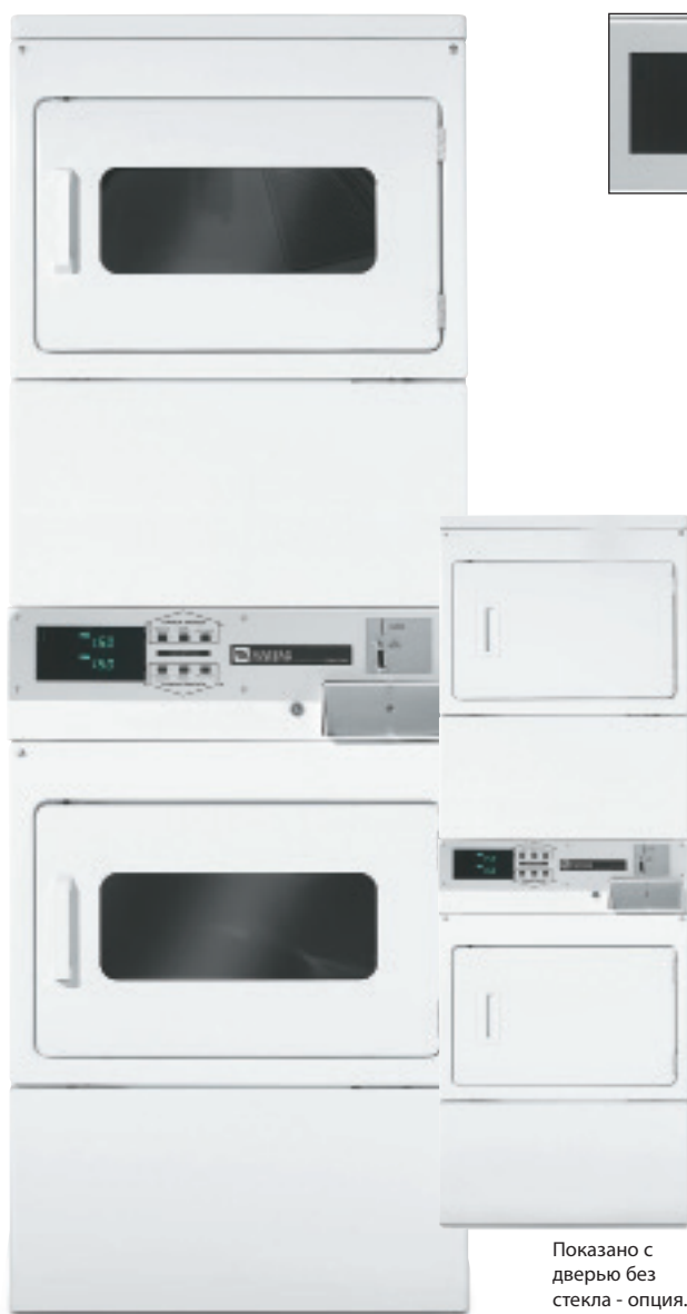
Показано с дверью без стекла - опция.

Повышаем эффективность ваших инвестиций более 50 лет.