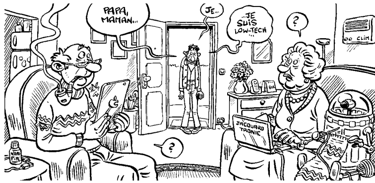
Illustration : Isa 64

Quel « technodurable » êtes-vous ? Pour vous aider à vous situer, voici un petit questionnaire en dix questions... À vos crayons (à papier) !