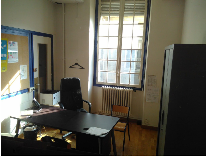
Atelier-Boutique numéro 9