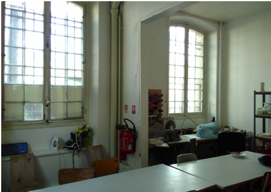
Atelier-Boutique numéro 6-7