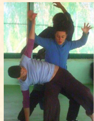
Tout niveau d'expérience en CI

Inscription souhaitée avant le 9 septembre 2017