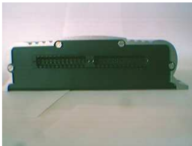
Нумерация разъемов XP1 и XP2 (вид с лицевой панели)