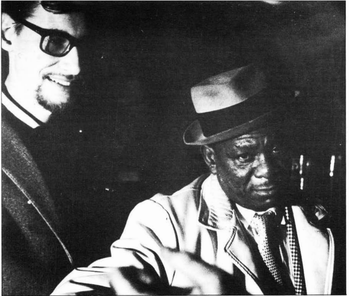
Met de onlangs overleden pianist Alton Purnell in The Old Cellar in Gent (1966)

Op het kollege werd ik aangetrokken door de jazz onder impuls van een medeleerling, die ons een beetje uit revolte conferenties gaf over jazz i.p.v. over Vivaldi of Mozart.