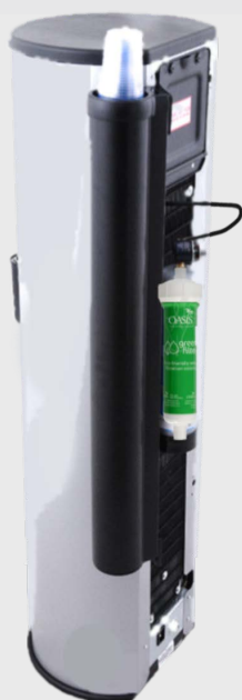
Option petite niche :