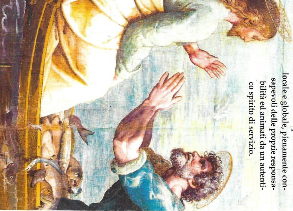
Immagine di copertina: Raffaello Sanzio (1515) La pesca miracolosa

Un programma di formazione integrata - riflessivo - in dialogo creativo con le scienze umane e socia- li, che afferma i valori della tradizione cristiana - incentrata sulla leadership di Gesù, per accompa- gnare e guidare con professionalità orga- nizzazioni che operano su scala locale e globale, pienamente con- sapevoli delle proprie responsa- bilità ed animati da un autenti- co spirito di servizio.