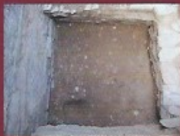
Posse de latrines - vue de dessus