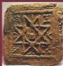
Pavement XVème siècle