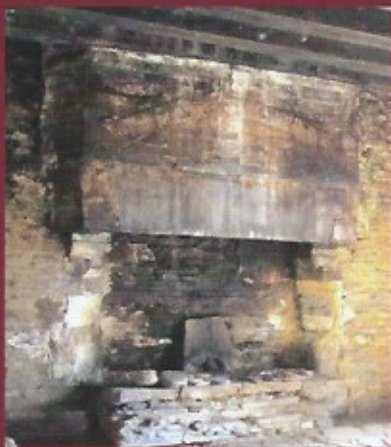
Cheminée monumentale de la salle basse

Cette étude a permis de mieux comprendre les techniques de construction de cette époque du Moyen-âge pour permettre une restauration respectueuse.