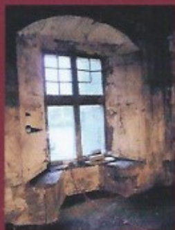
Grande fenêtre à meneaux et double coussiège

Il traverse la Révolution française sans encombre majeur mais l'étage carré du corps principal est raboté. Racheté en bien national par Seguin, Juge de Paix de la Gacilly.