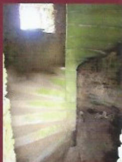
Escalier à vis en pierres de schiste

il est ensuite vendu aux Rado, parents des Guillard des Aulnays, puis aux Evain et aux Rollo qui le conserveront pendant un siècle et demi. Devenu bâtiment agricole, il échappera aux transformations du XXème siècle mais arrivera très essoufflé jusqu'à nous.