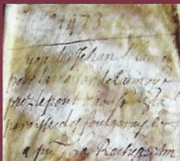
Aveu de Jehan de Launay - 1473

Erigé 7 ans avant la naissance d'Anne de Bretagne, en 1470 comme confirmé par l'analyse de dendrochronologie effectuée en 2014 sur l'ensemble des charpentes, linteaux et planchers, le manoir de la Cour de Launay aurait été construit par Jehan de Launay qui doit hommage à la seigneurie de la Roche-Gestin. La maison noble de Launay relève de la juridiction de la Cour de Rieux en Peillac.