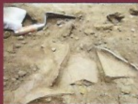
Tessons - Fouilles des latrines - juillet 2017