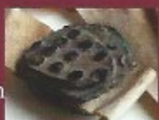
Seau de la Cour de Rieux en Peillac apposé sur les actes de la Maison noble de Launay

Passé successivement par mariage, vente ou même échange, des Launay aux Castellan, puis aux Mancel, aux Sérent, aux Burban puis aux Guynays-Le Coeur, puis de nouveau aux Burban puis aux Huchet de la Ville Chauve et aux Guillard des Aulnais, ce fief de basse et moyenne justice a davantage été considéré pour son rapport que comme un lieu de résidence. Dès lors, il a échappé aux vagues de modernisation des demeures nobles.