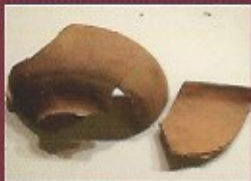
plat en terre - XVIe / XVIIe