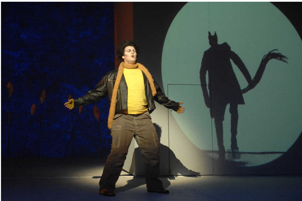
Ne criez pas au loup