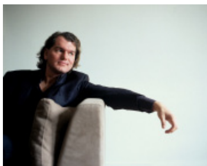
Oswald Sallaberger