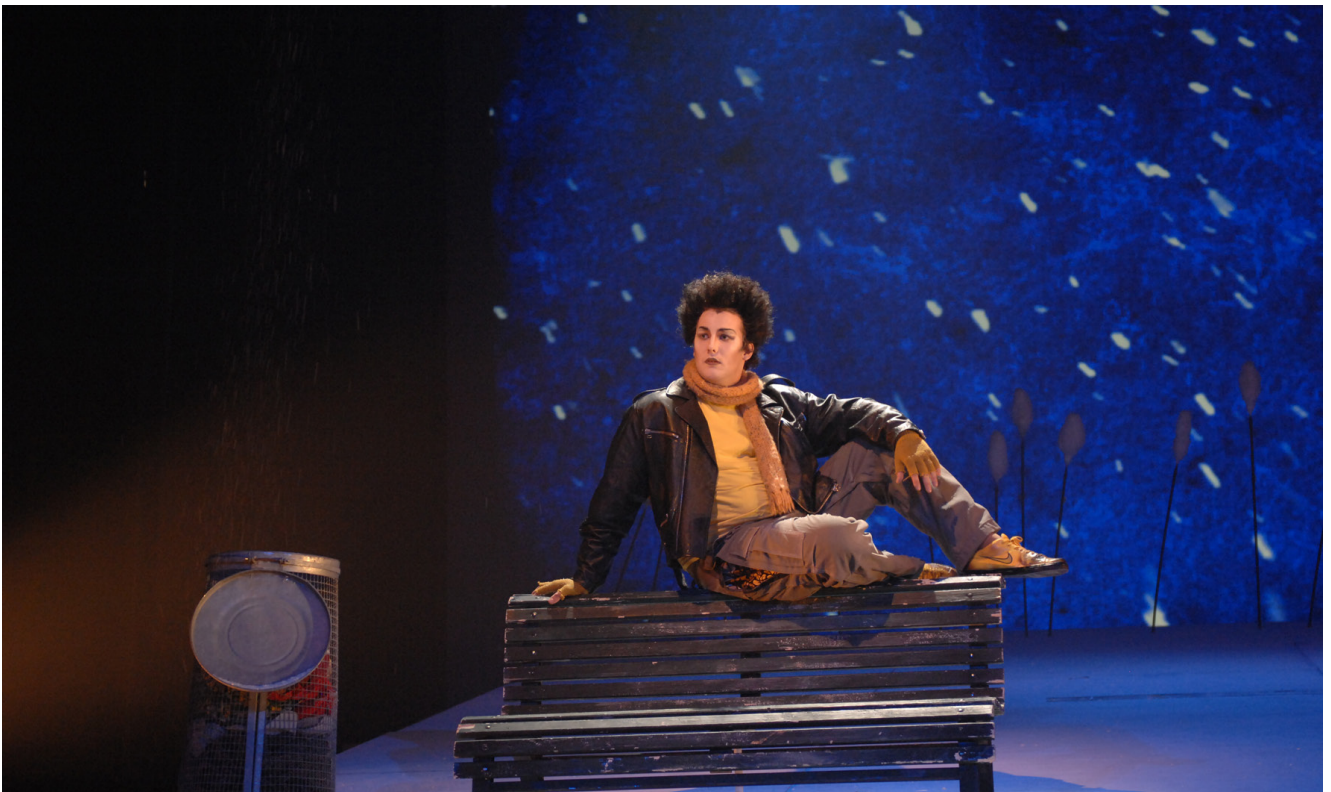
Ne criez pas au loup

La dame Tabourie et l'homme Sakili racontent la fin de l'histoire : deux enfants, emmenés par le loup durant une nuit de pleine lune, ont réalisé qu'ils n'avaient aucune raison d'avoir peur l'un de l'autre. En faisant connaissance, ils ont compris qu'ils étaient différents. Les deux enfants convainquent leurs parents d'abattre le mur d'ignorance qui séparait les deux tribus. La dame Tabourie et l'homme Sakili ne sont que ces deux enfants de l'histoire devenus adultes. La fillette obtient de son père que le loup, débarrassé de son déguisement, devienne sa nounou à temps plein !