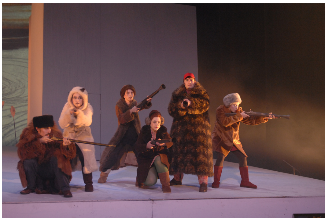
Ne criez pas au loup

Avec la participation de Maître Michel Rose, avocat. Pauses musicales par Benoît Hauchecome, auteur, compositeur, interprète.