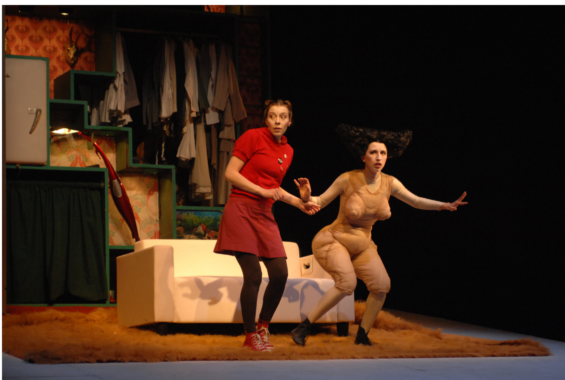
Ne criez pas au loup