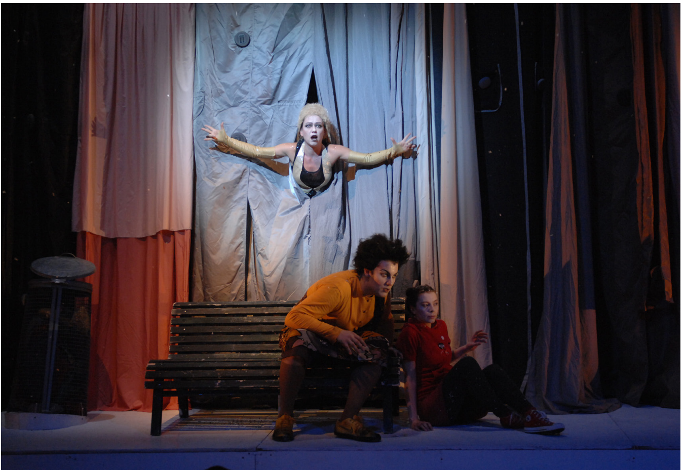
Ne criez pas au loup