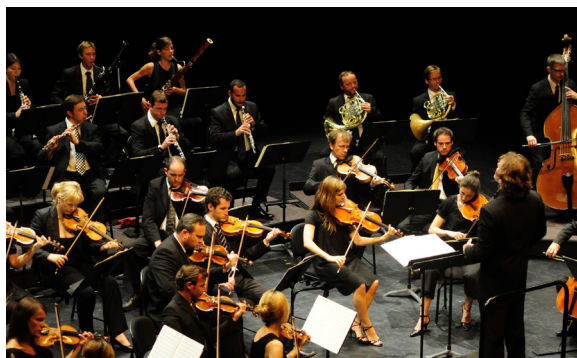
Orchestre de l'Opéra de Rouen Haute-Normandie