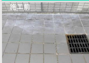
床タイル脱色の復旧 コートスーパー