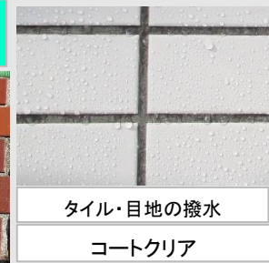
タイル・目地の撥水 コートクリア