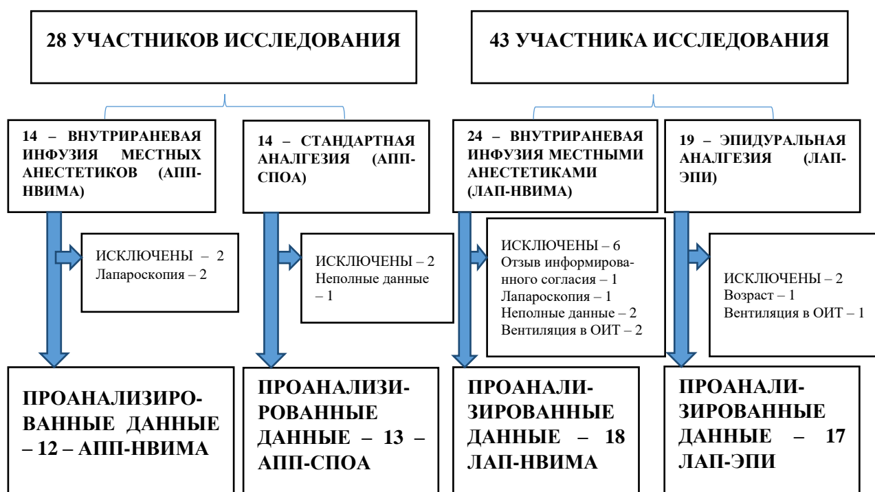
Рис. 1. Блок-схема включения участников в исследование.