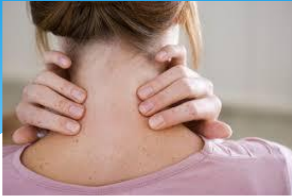
Tabla de ejercicios FORTALECIMIENTO MUSCULAR CERVICAL