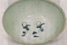
▲「青花嬰戲團碗」，屬明代晚期，以大小圓圈代表頭顱與軀體，幾根線條表達頭髮和四肢。