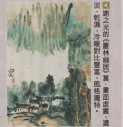
▲謝之光的《雲林幽思》賞，畫面虛實、濃淡、乾濕、冷暖對比豐富，風格獨特。