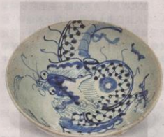
▲「青花過牆龍紋碗」，流行於清初康熙年間的過牆龍紋，青花龍從碗內面畫到外面，布局新穎。

青花瓷為極具中國特色的器物，明清時期的更屬珍品。因當時工藝技術成熟，工匠製作出高水準作品。大型展館多展示宮廷級的青花瓷作品，惟當時民間工匠同樣技藝嫺熟，瓷器圖畫抽象卻生動，別有一番意趣。簡筆畫又稱減筆畫，早於南宋時期出現，用筆粗獷簡練，寥寥數筆已捕捉所繪對象的特徵，既寫意又不失形似。兩者同樣展現藝術創作中的寫意畫風。