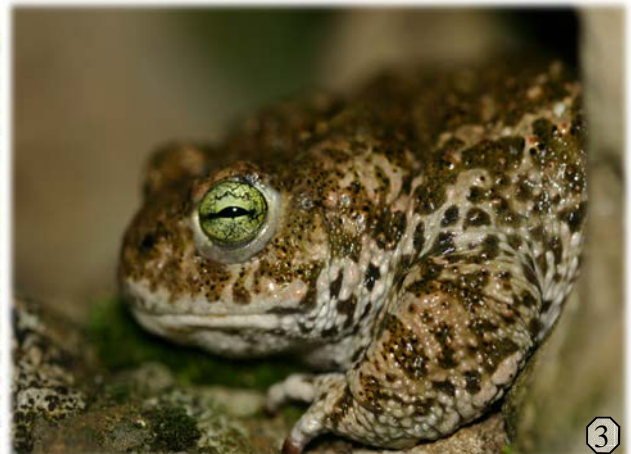
1- Agrion de mercure 2- Tulipe sauvage 3- Calamite des joncs