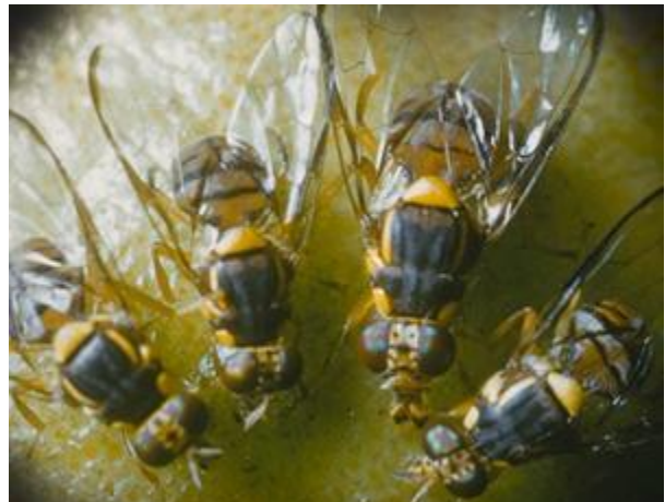
ที่มา: California Department of Food and Agriculture (ข้อมูล ณ วันที่ ๒๘ สิงหาคม ๒๕๖๑)