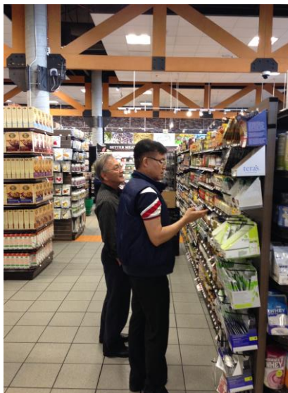
เลขาริการ มกอช. และคณะสำรวจตลาดสินค้าอินทรีย์และสินค้าธรรมชาติในนครลอสแอนเจลิส