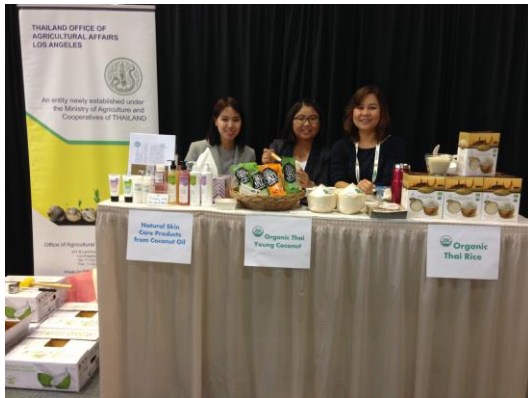
Tabletop ของฝ่ายการเกษตรประจำสถานกงสุลใหญ่ ณ นครลอสแอนเจลิส