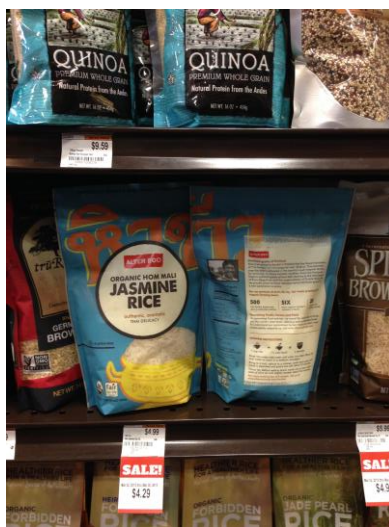
ข้าวหอมมะลิอินทรีย์จากประเทศไทยที่วางจำหน่ายในท้องตลาดแล้ว