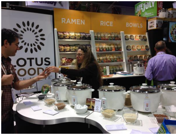
ข้าวอินทรีย์และผลิตภัณฑ์จากข้าว