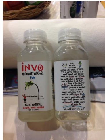
น้ำมะพร้าวจากประเทศไทยผลิตโดยวิธี High Pressure Processing (HPP)