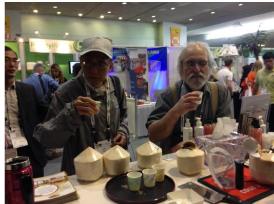
ผู้เข้าชมงานสนใจทดลองชิมน้ำมะพร้าวอินทรีย์