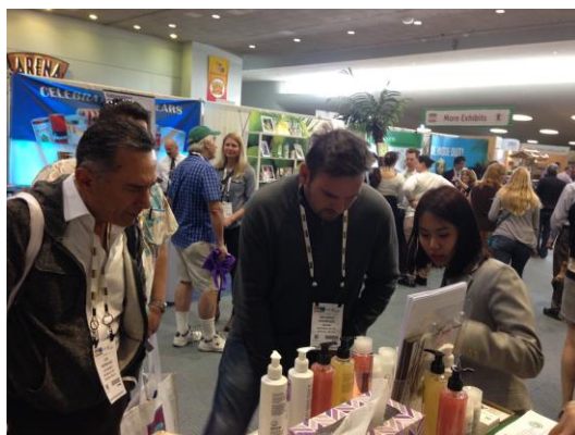
ผู้เข้าร่วมชมงานสนใจผลิตภัณฑ์บำรุงผิวจากน้ำมันมะพร้าว