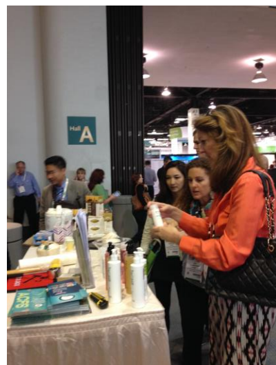
ผู้เข้าร่วมชมงานทดลองผลิตภัณฑ์จากน้ำมันมะพร้าว