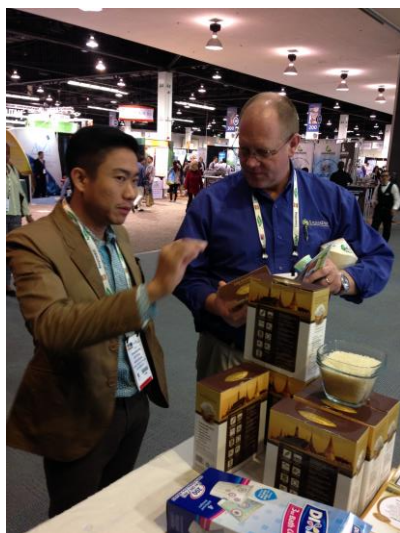
เจ้าหน้าที่ มกอช ช่วยนำเสนอข้าวอินทรีย์จากไทย