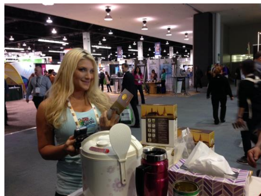
ผู้เข้าร่วมชมงานให้ความสนใจนำข้าวอินทรีย์ของไทย