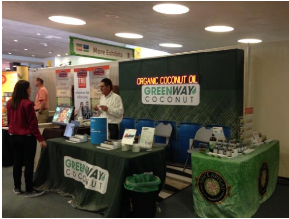
ส่วนหนึ่งของผู้ออกบูชในงานนำเสนอสินค้ำน้ำมันมะพร้าวอินทรีย์