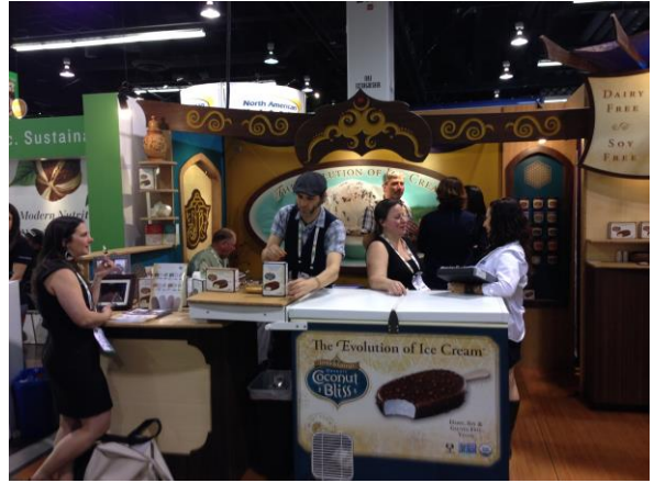
ผลิตภัณฑ์ไอศกรีมจากกะทิรูปแบบทันสมัย