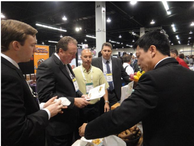
ผู้เข้าร่วมชมงานสนใจนำเข้ามาผลไม้จากประเทศไทย