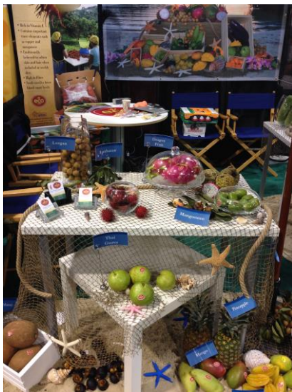
ผลไม้เขตร้อนของบรูไนอื่น ๆ ที่นำมาแสดงในงาน