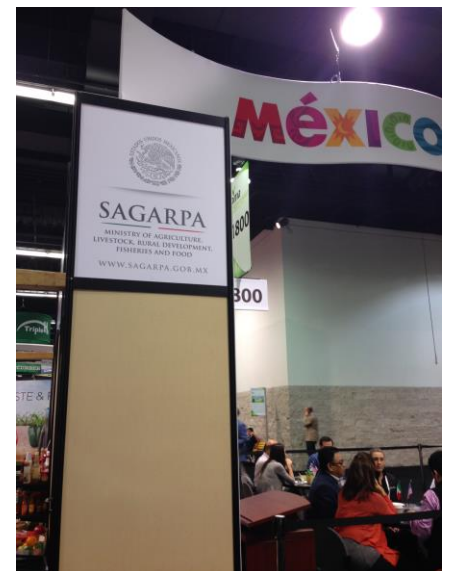
หน่วยงานภาครัฐด้านเกษตรของเม็กซิโกให้การสนับสนุน