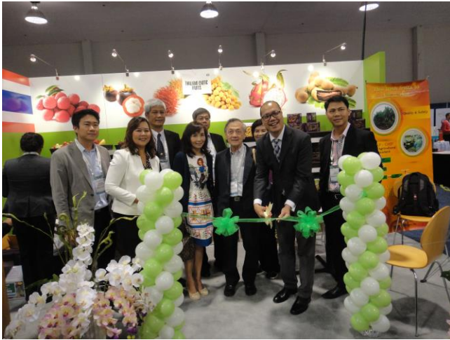
รองกงสุลใหญ่ ณ นครลอสแอนเจลิส ให้เกียรติเป็นประธานในพิธีเปิดบูธ