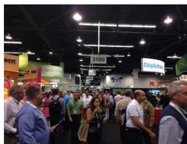
บรรยากาศภายในงาน