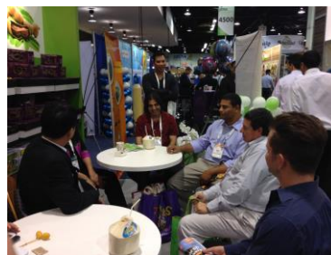
การเจรจาธุรกิจในบูธของไทย