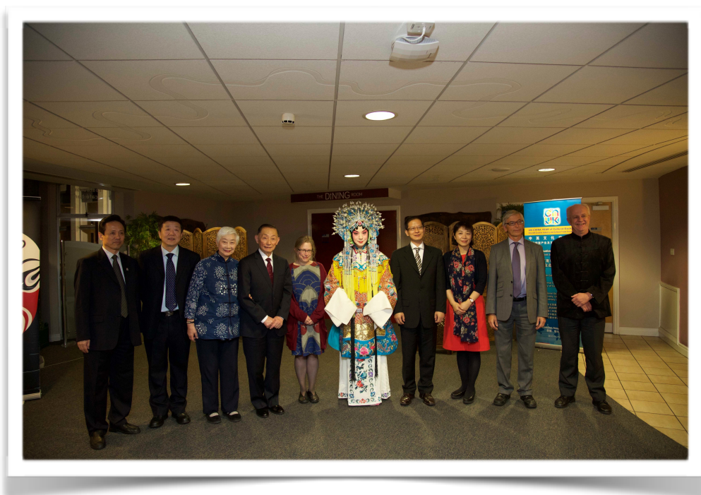
图为2015京剧大师梅葆玖老先生访问纽卡斯尔进行中英文化交流