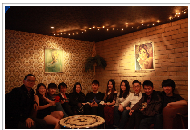
图为2015年11月11日学联举办的单身联谊派对