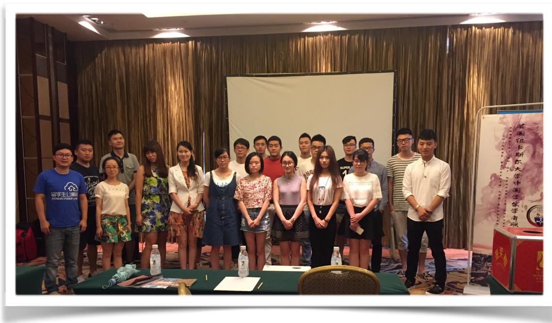
图为学联2015新生行前会成都站的合影