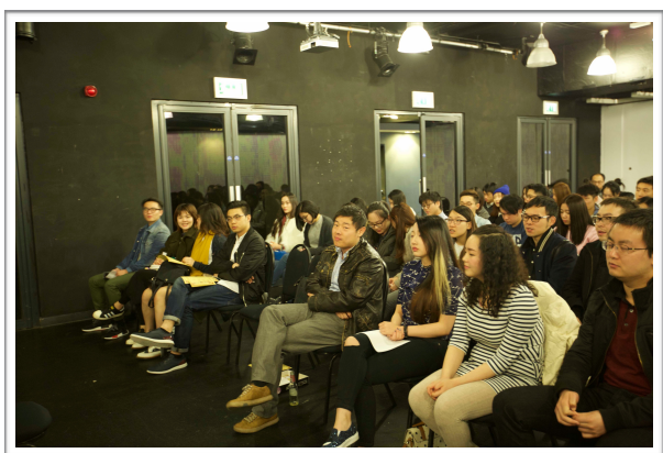
图为2016学联最后一次全体大会（暨换届选举）