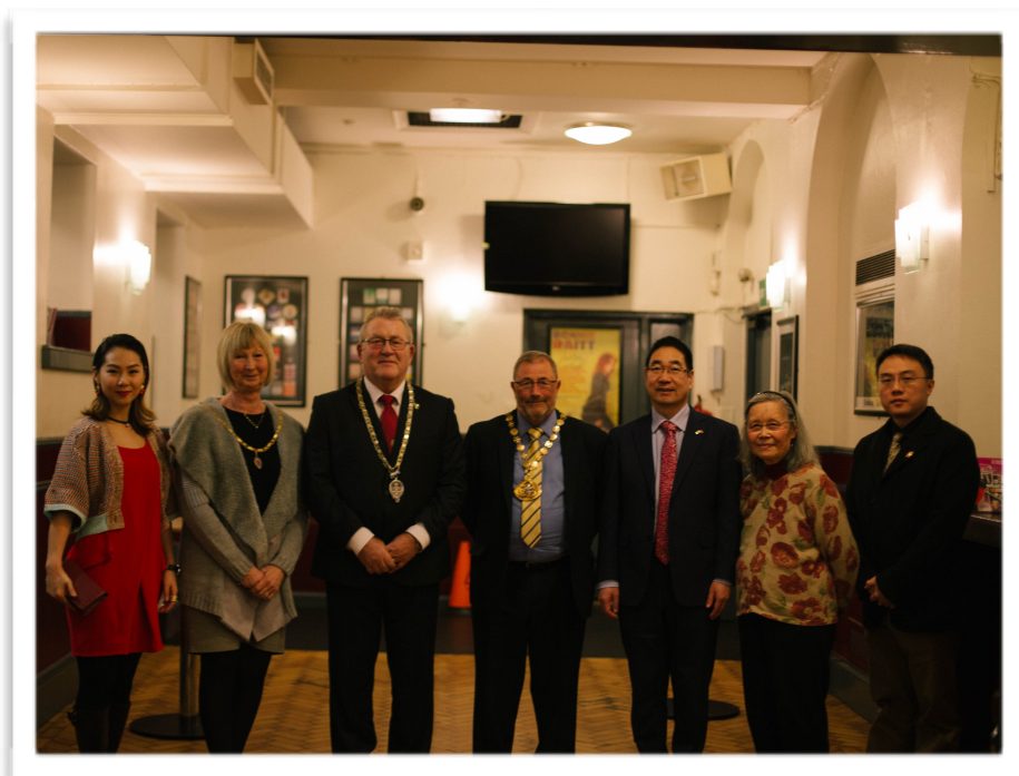
图为学联春晚到场的中华人民共和国驻曼彻斯特总领馆副总领事周海成先生、杜伦副市长Councillor Eddie Bell、桑德兰副市长Councillor Alan Emerson、中英文化交流协会创始人袁纪东教授、北部企业家协会会长戚勇强先生