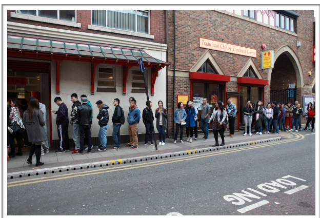
图为2015学联迎新美食节活动现场