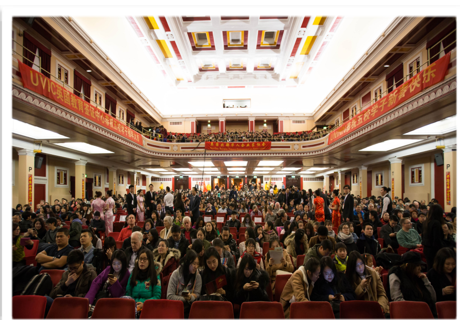
图为学联春晚于市政厅开场前的盛况