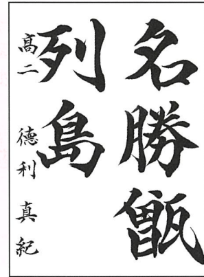
【書道部門】 德利 真紀(鹿児島市)