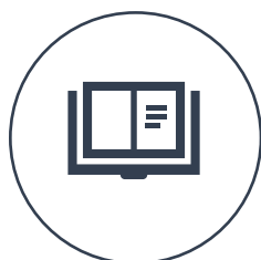
DUE FORMAT Intensivo e Esteso

L'apprendimento offerto da questo master non è soltanto una nuova fonte di vantaggio competitivo o una via per uscire dalla spirale della stagnazione: esso favorisce anche un approccio al lavoro di straordinaria efficacia in cui i singoli mettono in gioco tutta la propria creatività per far crescere l'impresa. Una scelta tra due format e tre sedi.