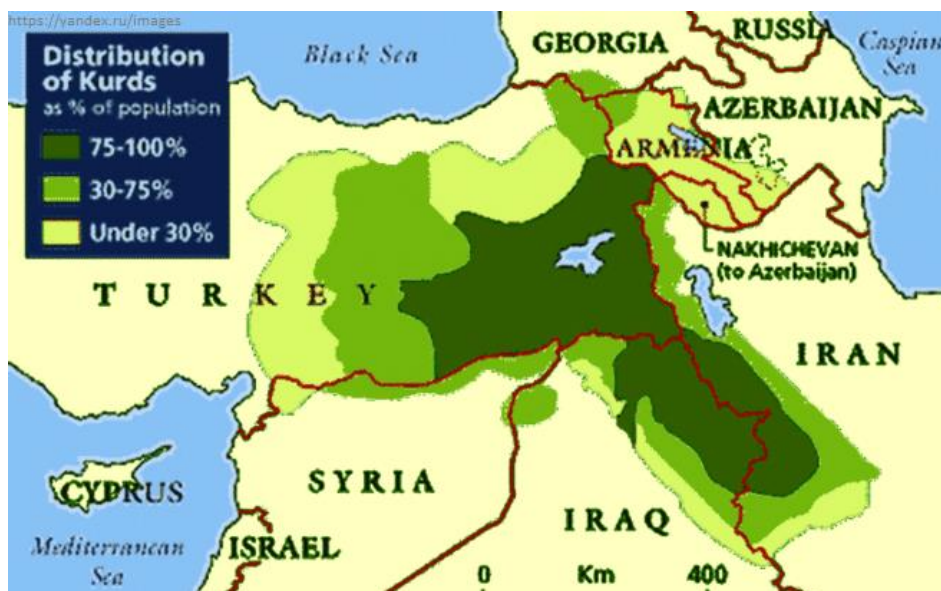
Рис. 1. Территория массового расселения курдов.

По ориентировочной оценке, общая численность курдов в ближневосточном регионе составляет от 27 до 40 млн. человек. Из них около 55% живут на территории Турции, по 20% проживают в Иране и Ираке и немногим более 5% находятся в Сирии (рис.1). Курды составляют около 20% населения Турции, 17% населения Ирака, 7% населения Ирана и около 9% населения Сирии. При этом следует отметить важную особенность курдского народа – это отсутствие религиозного фанатизма, что для Востока является необычным. Курды всегда подчеркивают, что ислам для них скорее культура и обычаи, чем религия 3 .