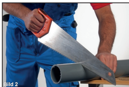
Kapa röret rakt