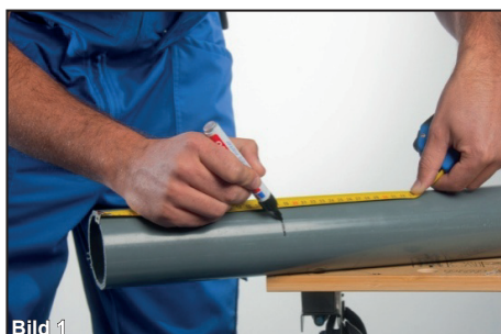
Markera röret med en markeringspenna

Läs även igenom relevanta sidor för aktuellt lim och rengöring. (Sidorna 212-216)