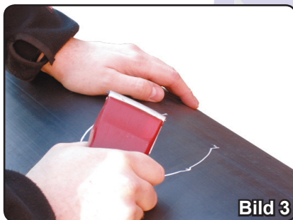
Bild 3. Du ska nu skrapa bort oxidskiktet (minst 0,2mm) med exempelvis en handskrapa eller svarv. Oxidskiktets tjocklek varierar och beror på ålder, samt lagring av röret. Den markerade ytan + 1 cm utanför markerat område ska skrapas.

Anledningen till att man ska skrapa 1 cm extra är för att det ska gå att se i efterhand att ytan är skrapad. Bild 4. Skrapad yta.