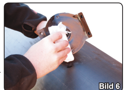
Bild 6. Även detaljen ska rengöras noga. Samma sak som röret, viktigt är att du inte vidrör ytan med händerna efter rengöringen. (Fettfritt)

Bild 5. Du ska nu rengöra röret med en rengörings-sprit som överstiger 96%. Viktigt är att du inte vidrör ytan med händerna efter rengöringen. (Fettfritt)