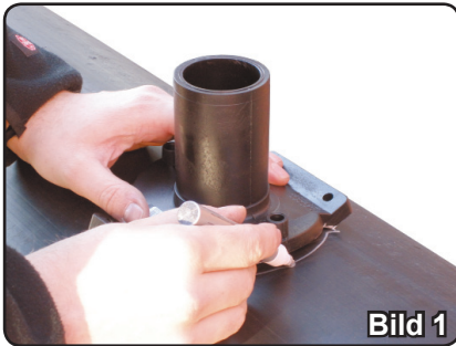
Bild 1. Markera med markeringspenna var du ska montera toploadingsadeln.

Montering och svetsning får endast utföras inom temperaturområdet -10°C till +45°C. Normerna som finns framtagna gäller endast detta temperaturområde. Är temperaturen utanför detta område, kontakta oss innan jobbet påbörjas. Arbetsplatsen ska skyddas från smuts, kemikalier, vatten/regn, vätska och fukt. Använd lämpliga skyddsanordningar vid behov, tex svetsstält. Om temperaturen där svetsningen ska utföras är -10°C eller kallare, så måste den omgivande temperaturen för både detalj, rör och svetsmaskin höjas.