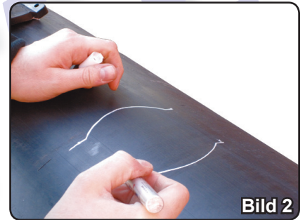
Bild 2. Markerad yta.

OBS! Du får inte anborra röret förrän du svetsat fast sadeln och inväntat kyltiden!