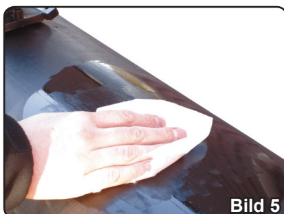
Bild 5. Du ska nu rengöra röret med en rengörings-sprit som överstiger 96%. Viktigt är att du inte vidrör ytan med händerna efter rengöringen. (Fettfritt)

Bild 6. Även detaljen ska rengöras noga. Samma sak som röret, viktigt är att du inte vidrör ytan med händerna efter rengöringen. (Fettfritt)