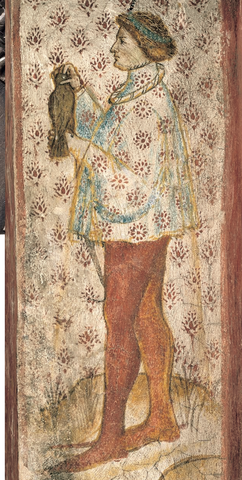
Falkner, Schloss Runkelstein Falconiere, Castel Roncolo