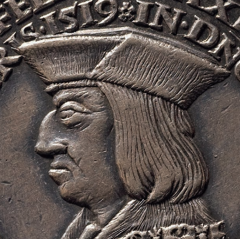
Schaumünze Maximilians – Moneta celebrativa di Massimiliano

In 1501, Emperor Maximilian I visited his Runkelstein Castle and saw the splendid frescoes painted around 1400 on behalf of the bourgeois Vintler family: the adventures of knights and heroes, and especially the characters of the triads along the Summer House. The images of Runkelstein Castle had a profound impact on the Emperor and his culture of remembrance, the images becoming models for literary and figurative works and subsequently inspiring the famous cenotaph of Innsbruck, watched over by those heroes and ancestors that he had also met in the Illustrated Runkelstein Castle.