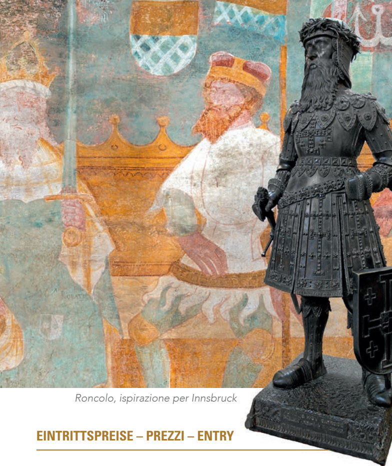
Roncolo, ispirazione per Innsbruck