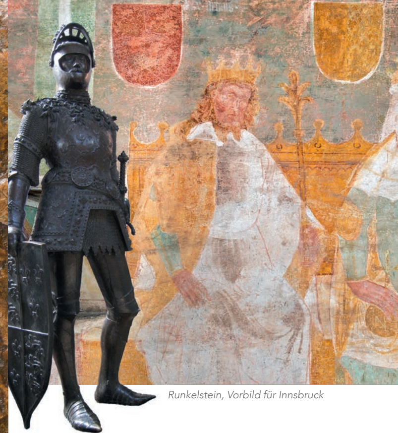
Runkelstein, Vorbild für Innsbruck