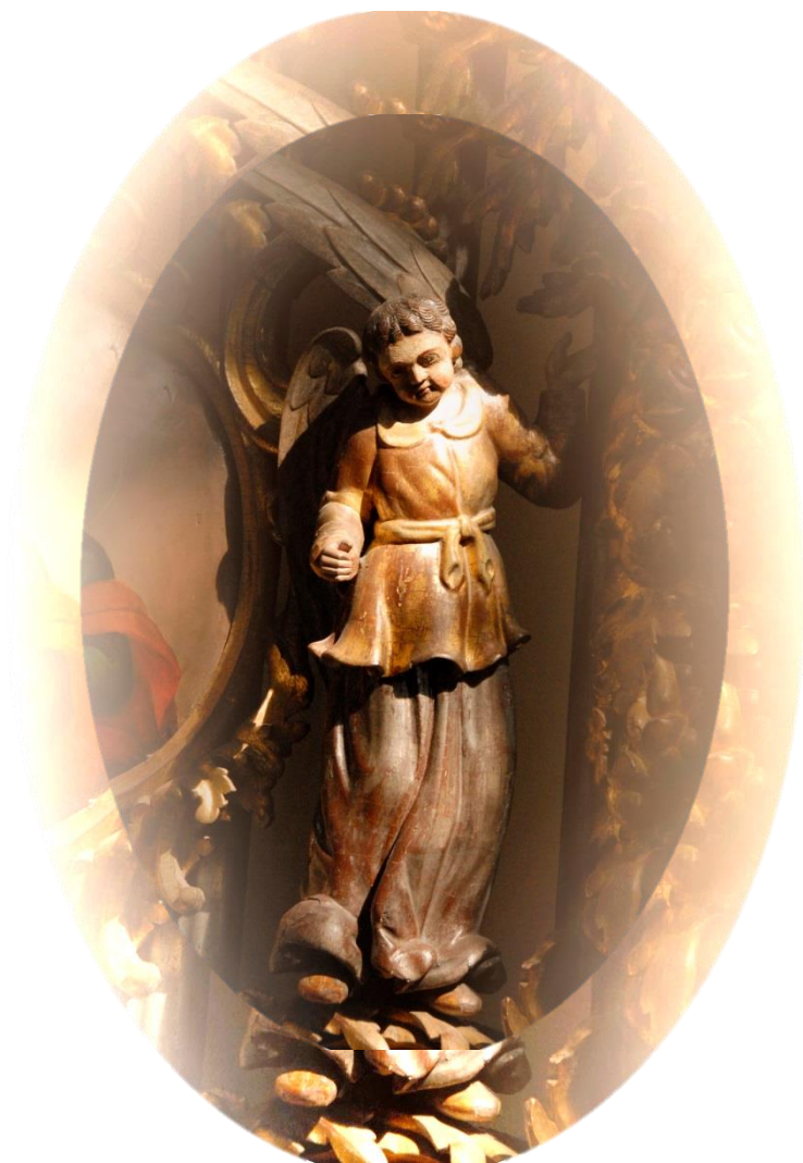
Ангел Златых Врат Пермская деревянная скульптура XIX в.