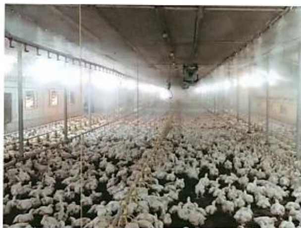
מערכת קול מיסט מפורת ערפל מצנן. התקנה והפעלה פשוטות. הטמפרטורה נוחה לעופות בלול בזמן הפעלת המערכת.