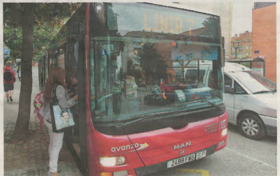
L'incident que denuncia SOS Racisme va passar a la L7 del bus.

F.T.S. va baixar del bus a la Zona Olímpica i va trucar al 112. Posteriorment va ser traslladada en ambulància a l'Hospital de Terrassa, on va ser atesa. ▸