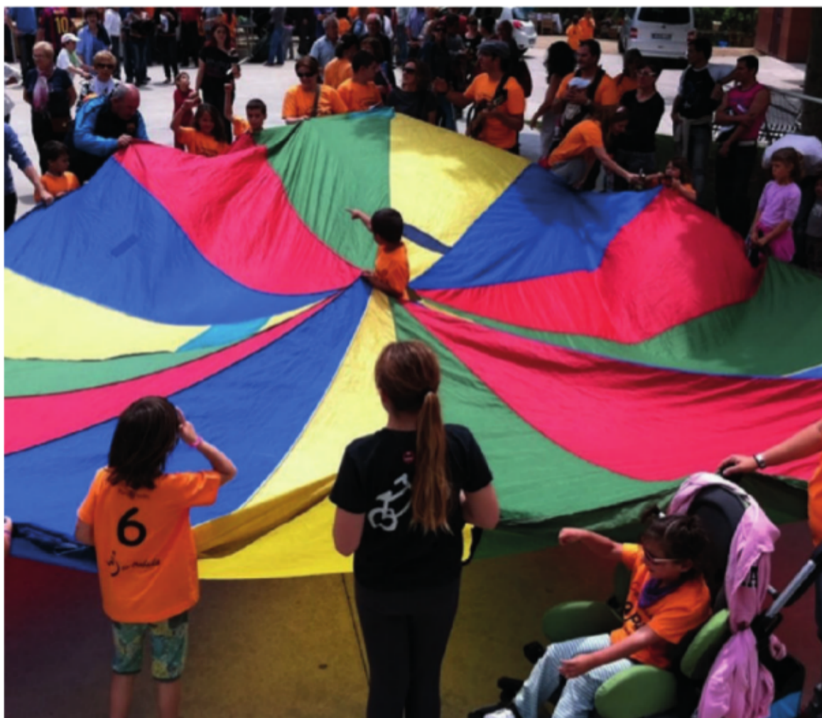
■ Festa de la coordinadora Capaç al parc de Vallparadís

titats de la ciutat: el Manifest ja té l'adhesió de la Síndica de Greuges de Terrassa i de diverses entitats: Federa-