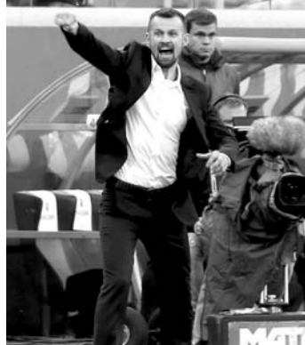
Радость главного тренера «Зенита» Сергея Семака

Это был потрясающий по накалу и красоте матч, доставший огромное удовольствие самим игрокам, специалистам и 50 тысячам болельщиков. «Зенит» доминировал почти на протяжении всей встречи, играл раскованно, изобретательно и, главное, забивал и... увы, пропуская, о чём наглядно свидетельствует табло в фоторепортаже Фёдора Кислякова.