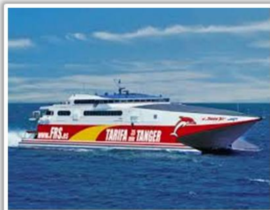
Travessia do Estreito de Gibraltar

Jantar de boas vindas e briefing do tour