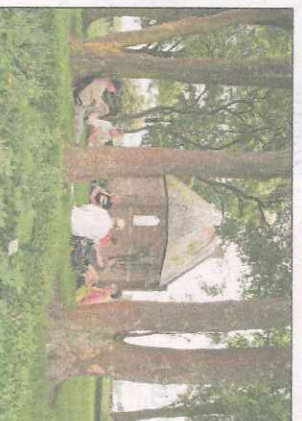
© TAU - Franciscanse spiritualiteit vandaag

In het buitenland vinden groepen die zich inspireren op de tradities van de oude orden en congregaties nieuw leven. Hoe zit dat in Vlaanderen?